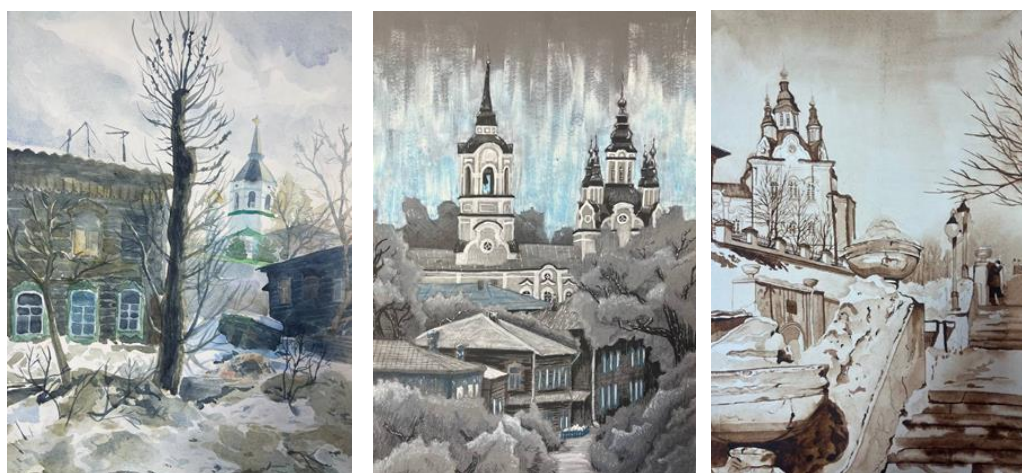
Рисунок 3. – Работы обучающихся ОГБПО «КИПТСУ»

3. Отражают культурные особенности региона: архитектуру, традиции, быт. Рисуя такие пейзажи, ученики узнают о разнообразии культур в своей области, городе, стране. Учатся уважать чужие традиции и обычаи. Рисунки выполнены в живописной технике (Рисунок 3.).