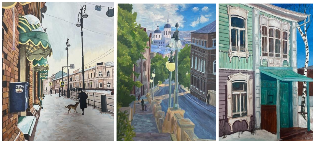
Рисунок 2. – Работы обучающихся ОГБПО «КИПТСУ»

3. Отражают культурные особенности региона: архитектуру, традиции, быт. Рисуя такие пейзажи, ученики узнают о разнообразии культур в своей области, городе, стране. Учатся уважать чужие традиции и обычаи. Рисунки выполнены в живописной технике (Рисунок 3.).