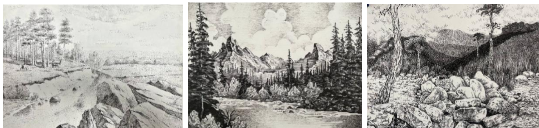
Рисунок 1. – Работы обучающихся ОГБПО «КИПТСУ»

1. Проникаются красотой родного края и её уникальностью, так как рисуя и погружаясь в процессы создания композиции, понимают, что природа настолько многогранна и богата разнообразием ландшафта, флоры и фауны, что хочется передавать ее многообразие. Изображая родные места, обучающиеся формируют чувство гордости за свою землю. Представленные работы выполнены гелевой ручкой в черно-белой графике с применением выразительных средств графики – точка, линия, штрих, пятно (Рисунок 1.).